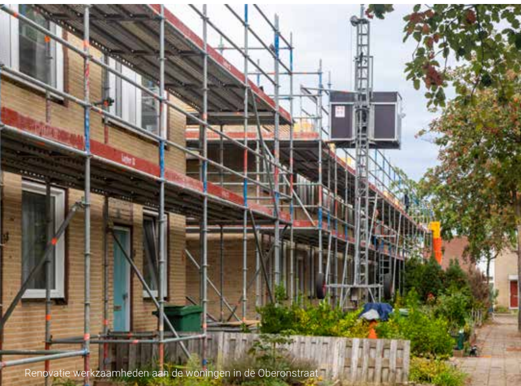
Renovatie werkzaamheden aan de woningen in de Oberonstraat