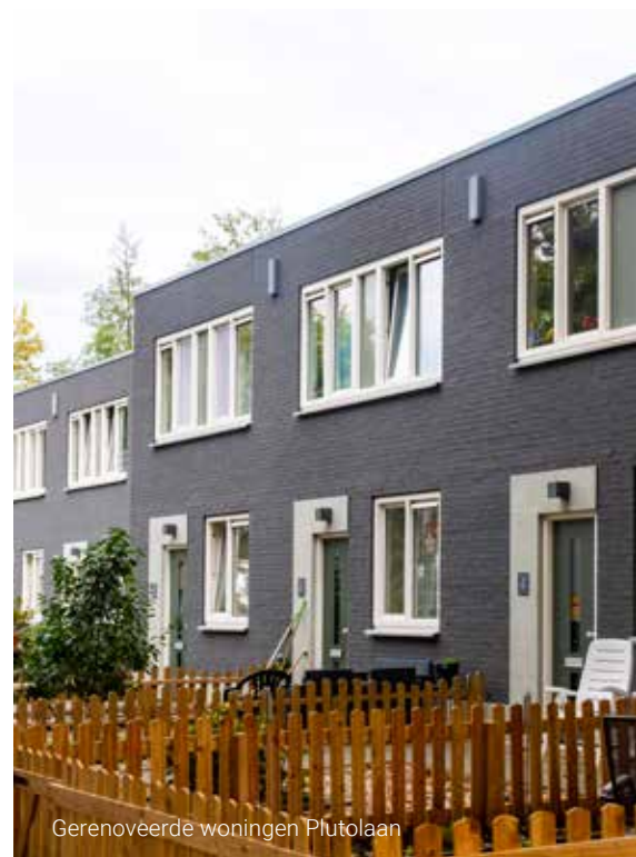
Gerenoveerde woningen Plutolaan